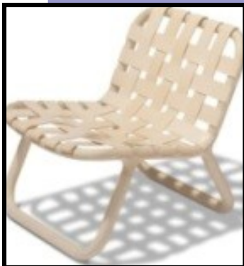
Camping stolen Designer Jesper K. Thomsen Producent Normann Copenhagen

Opgaven er nu at forene dette med Kvist's know-how og fleksibilitet på fabrikkerne i Årre og samtidig at udnytte de logistiske og økonomiske fordele som Kvist's fabrik og underleverandører i Slovakiet tilbyder. Dette arbejde er vi allerede godt i gang med, og vi ser rigtig gode fordele for både os selv og vore kunder i fremtiden.