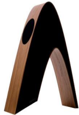
Rithm - Davone Audio Kvist Industries framställer högtalarkabinetten

Kundportföljen omfattar bland annat en av världens största högtalarproducenter av high-end hi-fi.