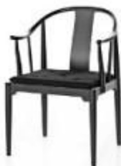
Kinastolen – Fritz Hansen Kvist Industries tillverkar och monterar klart stolen.

Kvist Industries är en mellanstor internationell koncern, som är underleverantör av trä-komponenter eller totallösningar till flera möbel-designföretag. Våra primära kompetenser och historia knyter an till möbelindustrin, där vi producerar en lång rad världskända designklassiker.