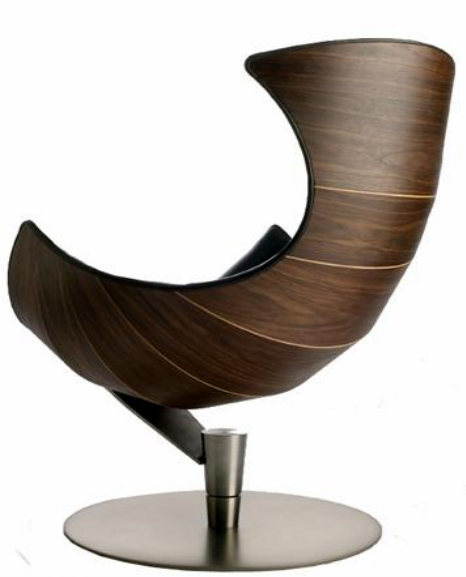
Lobster by Strictly design Kvist Industries har produktutvecklat och tillverkar träskalen.

Med vårt stora nätverk av välkända designers, såväl som lovande talanger, erbjuder Kvist Industries att vara en initierande och aktiv partner i produktutvecklingen. Detta är med hänsyn på ett starkare relationssamarbete i förhållande till traditionell produktutveckling och produktions-anmodning.