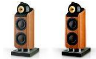
800D - B&W Bowers & Wilkins Kvist Industries framställer högtalarkabinetten