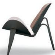
CH07 – Carl Hansen & Søn Kvist Industries framställer de laminerade delarna