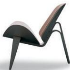
CH07 – Carl Hansen & Søn Kvist Industries fremstiller laminerede dele