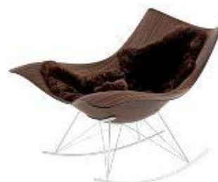
Stingray – Fredericia Furniture Kvist Industries fremstiller træ skallen

Vort største forretningsområde, hvor vi som markedsleder i Nordeuropa kan tilbyde den største kompetence og vidensbase til vore kunder indenfor produktudvikling og produktion af formspændt lamineret træ, massivt træ, limtræ og laminatbordplader. Kundeporteføljen tæller blandt andet de største danske møbelproducenter af danske designklassikere.