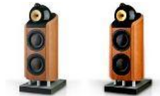
800D - B&W Bowers & Wilkins Kvist Industries fremstiller højtalerkabinettet