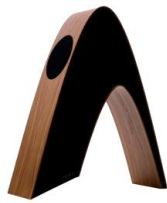
Rithm - Davone Audio Kvist Industries fremstiller højtalerkabinettet

Med vores store netværk af anerkendte designere, såvel som lovende talenter, tilbyder Kvist Industries at være en initierende og aktiv partner i produktudviklingen. Dette er med henblik på et stærkere relations-samarbejde i forhold til traditionel produktudvikling og produktionsmodning.